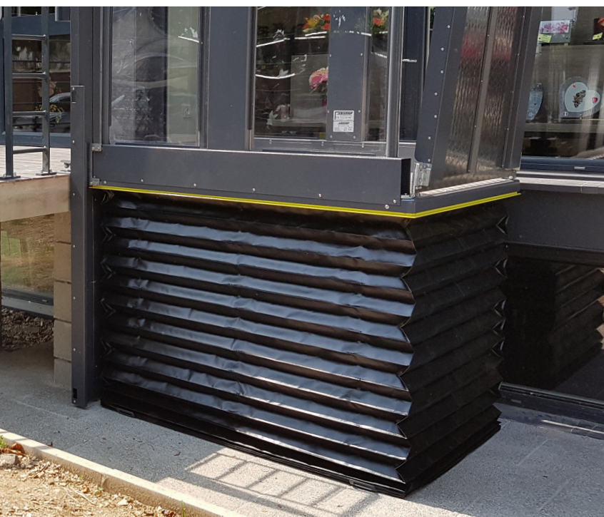
Faltenbalg und Kontaktleiste an allen 4 Seiten sorgen für höchste Sicherheit

Türen können manuel oder automatisch öffnen