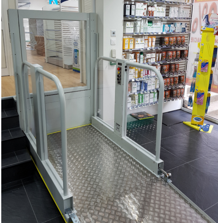
Anlage lieferbar in jeder beliebigen RAL Farbe (Standardfarbe RAL 7035)